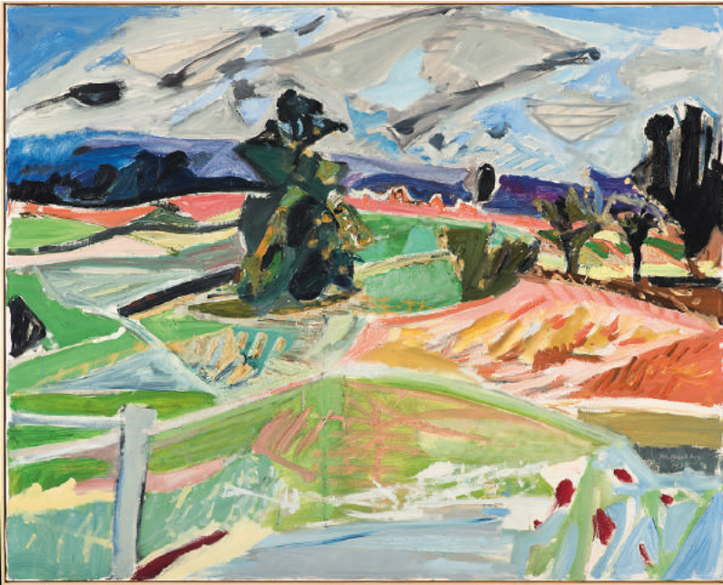
Regenwolken, 1956 Öl auf Leinwand