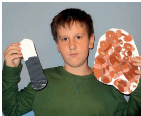
Bild im Museum

Ich fand es toll, als wir im Museum waren. Ich fand das Bild toll. Es hat eine Pyramiden Form. Es sieht aus wie ein Alltagsbild, weil es hat Dinge aus dem Alltag. Es sind so viele verschiedene Sachen auf dem Bild. Fast jeder Gegenstand hat eine Bedeutung zum Beispiel: das Messer sollte den Tod darstellen oder die Rose steht für Liebe und das Brot für Essen. Ich hoffe, dass es den Besuchern genau so gut gefällt, wie mir.