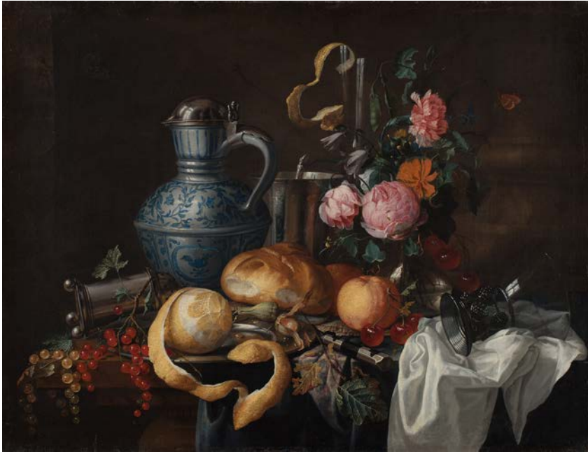
Stillleben mit Blumen und Steingutkanne, um 1650 Öl auf Leinwand

Jan Davidsz. de Heem war einer der bedeutendsten holländischen Stilllebenmaler und schuf zahlreiche Werke dieser beliebten Bildgattung. Die Bezeichnung Stillleben rührt daher, dass auf diesen Gemälden meist reglose und leblose, also stille Gegenstände arrangiert sind. Kennzeichnend für die Stilllebenmalerei ist der Trompe l'oeil-Effekt: Die Dinge sind so realistisch wiedergegeben, dass sie täuschend echt erscheinen.