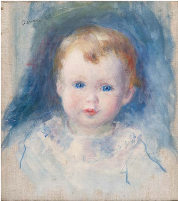
Kinderbildnis, 1882 Öl auf Leinwand