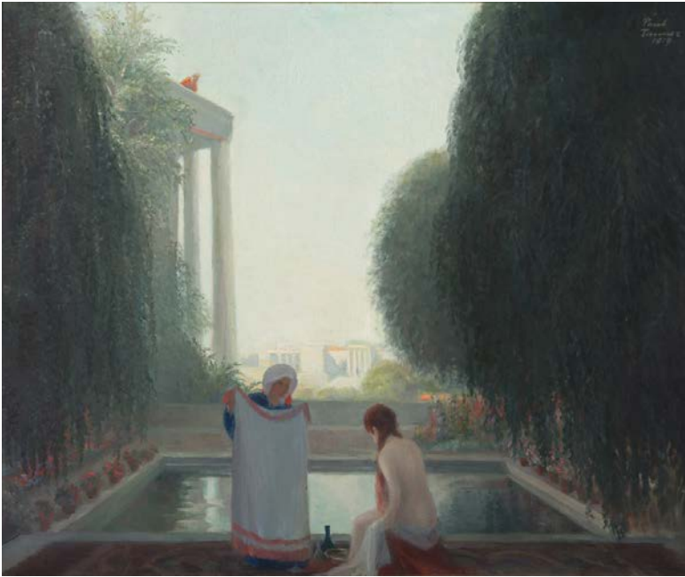
Bathseba, 1919 Öl auf Leinwand