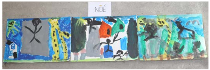
Bild 1 Der Mann klettert hoch und er kommt nicht wieder runter. Dann hat er eine Idee und sie haben einen Freund und er ist eine Giraffe und er ruft ihr, und dann kommt die Giraffe und dann können beide wieder runter.

Bild 2 Der Mann kuckt auf die Häuser und die Frau ist immer noch im Pool und die andere Frau holt das Tuch und am Himmel sind Wolken und ob der Wolken sind Vögel.