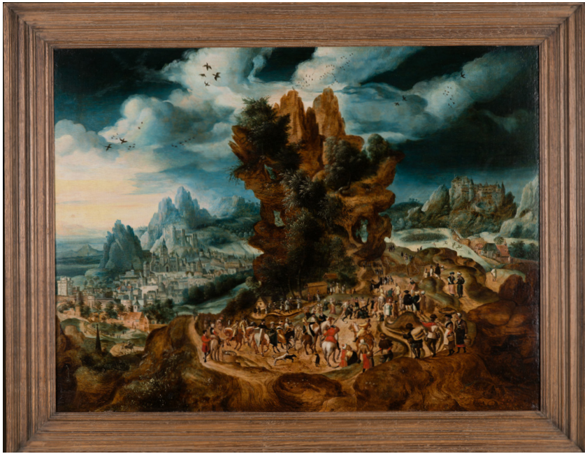
Der Weg zum Kalvarienberg, um 1540

In dieser symmetrisch aufgebauten Komposition steht im Zentrum eine bizarre Felsformation, vor der sich eine dramatische Szene abspielt. Im Mittelgrund eröffnet sich links und rechts der Blick auf eine weite Landschaft, in der linkerhand eine Stadt eingebettet ist. Der Himmel ist dramatisch mit aufgetürmten Wolkenformationen gestaltet. Der Aufbau der Landschaft wirkt künstlich. Es handelt sich um eine sogenannte Weltlandschaft, die wir aus der Vogelperspektive betrachten. Die Landschaft versteht sich als eine Art Bühne für die dargestellten Szenen: Links sehen wir den Auszug Jesu aus Jerusalem, in der Mitte Jesus auf seinem Kreuzweg und rechts die Kreuzigung auf Golgota. Wir sehen also eine simultane Darstellung von drei Ereignissen, die eigentlich nacheinander stattfinden. Gemalt wurde dieses Bild von Herri met de Bles. Er war ein flämischer Landschaftsmaler der Renaissance. Er wird einer Gruppe flämischer Maler in Antwerpen zugeordnet, die als Nachfolger von Hieronymus Bosch (um 1450/1460–1516) die Tradition phantastischer Malerei fortführten. Aus dem Leben dieses Malers ist kaum etwas bekannt.