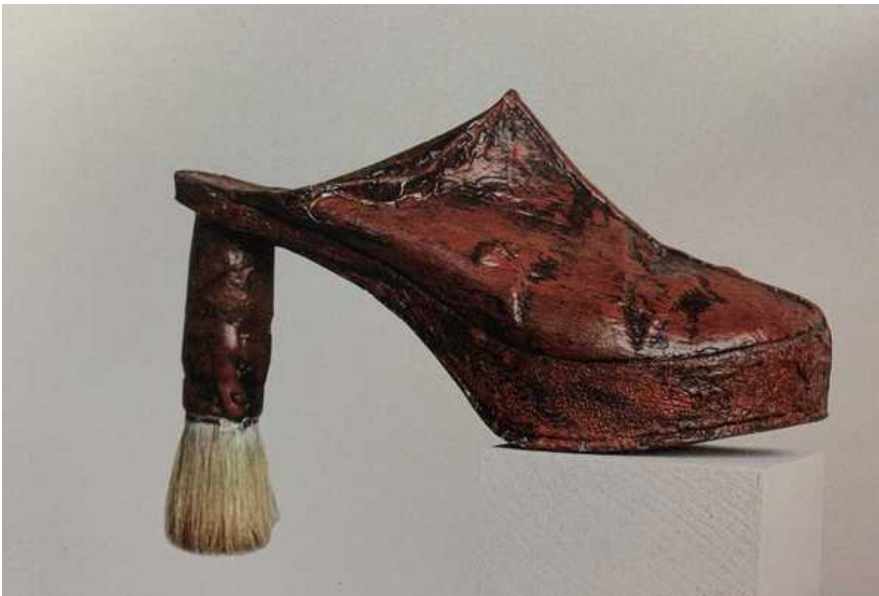
Schuh mit Pinsel, 1977