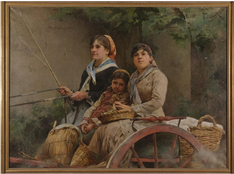
Auf dem Weg zum Markt, 1870

Raffaele Faccioli wurde 1845 in Bologna (Italien) geboren. Schon früh zeigte er grosses Talent für die Kunst. Er studierte an der Kunstakademie in Bologna und nahm erfolgreich an Ausstellungen teil. Später wurde er ein angesehener Maler und erhielt viele Auszeichnungen.