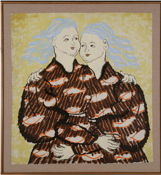
Je m'aime, 1945

Zoltán Kemény (1907-1965) war ein ungarisch-schweizerischer Bildhauer, Maler und Architekt. Aus Unzufriedenheit mit dem kunstkritischen und reaktionären Regime verliess er nach einem Kunststudium seine Heimat Ungarn und ging nach Paris. Während des zweiten Weltkriegs kam er in die Schweiz und arbeitete in den 1940er Jahren als Redaktor bei der Zeitschrift Annabelle . Gleichzeitig widmete er sich immer mehr der Kunst. Er malte und gestaltete Metallreliefs, so zum Beispiel auch eines für die Universität St.Gallen. Dafür verwendete er industrielle Standardelemente wie Nägel, Stangen und Rohre und ordnete diese in sich wiederholenden Strukturen an.